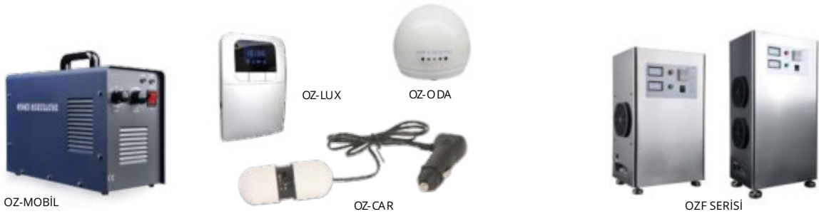
EVSEL TİP OZON JENERATÖRLERİ